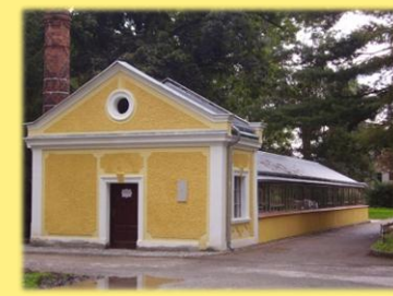
Rekonstrukce zámeckého skleníku ve Svitávce

CELKOVÉ NÁKLADY REALIZOVANÝCH PROJEKTŮ V LETECH 2006 – 2010: 50 103 236 Kč