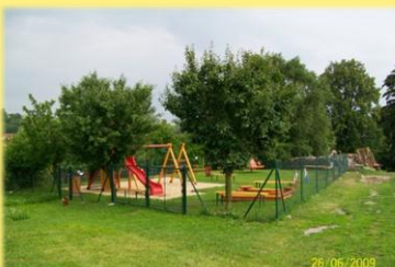
Úprava a okolí penzionu u Ševčíků a rozšíření jeho služeb