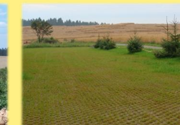
Kulturně společenský areál Kozárov