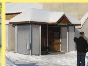
Rekonstrukce autobusových čekáren v Drnovicích