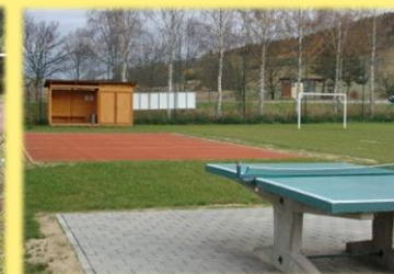
Víceúčelové sportovní hřiště Mladkov